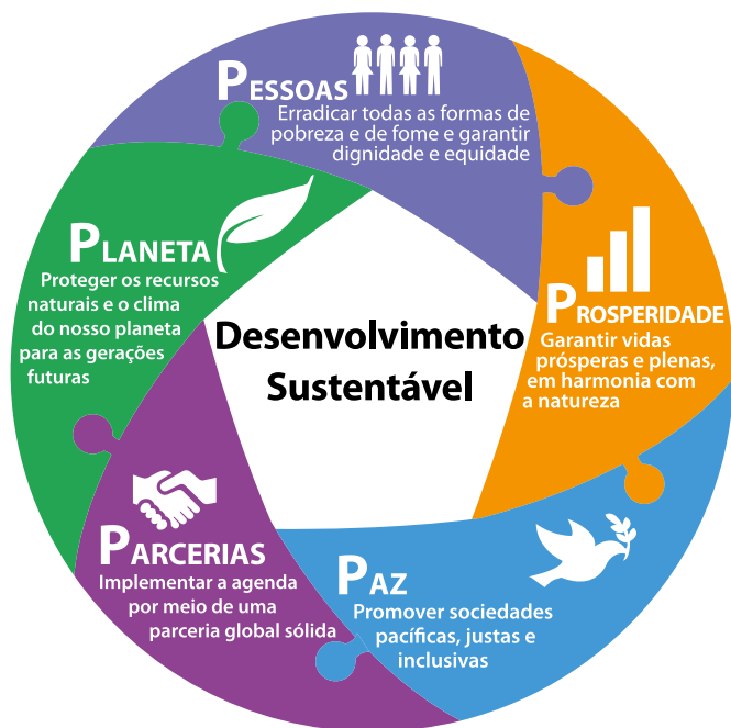
Figura 2: Os 5 P's da Agenda 2030

Dessa maneira, a Agenda 2030 também pode ser entendida por meio de cinco P's: Planeta – proteção dos recursos naturais e do clima, Pessoas – erradicação da pobreza, da fome e a garantia de igualdade, Prosperidade – garantia de vidas prósperas e plenas, Paz – promoção de sociedades pacíficas, justas e inclusivas e Parcerias – implementação da agenda por meio de parcerias sólidas. Todos os ODS são pensados considerando esses cinco eixos, de maneira a garantir o pleno desenvolvimento humano sustentável e não deixar ninguém para trás.