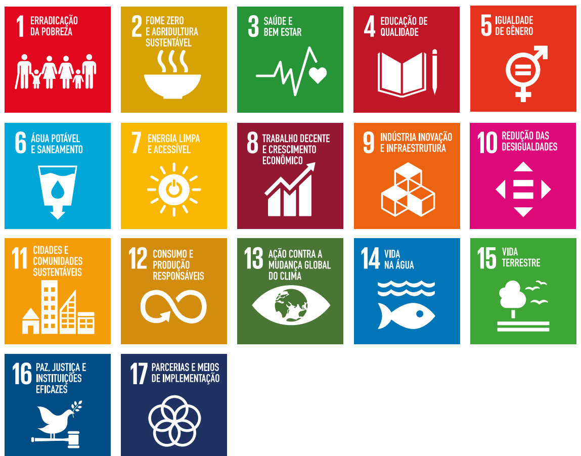
Figura 1: Objetivos de Desenvolvimento Sustent vel

Em setembro de 2015, o Brasil e mais 192 na es assinaram o acordo “Transformando Nosso Mundo: a Agenda 2030 para o Desenvolvimento Sustent vel”, a Agenda 2030 – um plano de a o para erradicar a pobreza, proteger o planeta e garantir que as pessoas alcancem a paz e a prosperidade. A Agenda 2030 apresenta 17 Objetivos de Desenvolvimento Sustent vel (ODS), 169 metas e seus indicadores relacionados, que visam proteger o planeta das mudan as do clima e fazer do mundo um lugar mais justo e mais seguro para todos, buscando fortalecer a paz universal.